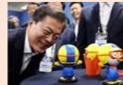
인공지능 로봇 보로봇